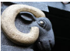
Indrukwekkende ramskop in de portiek van een bankgebouw uit 1920, nu café hotel Dulac.

Op nr 124 staat de Posthoorn, een kerk uit 1863 van Pierre Cuypers. De Grondwet van 1848 verzekerde godsdienstvrijheid. Er werden weer veel katholieke kerken gebouwd zoals de Posthoorn, de Nicolaaskerk, de Vondelkerk. De parochie van de Posthoorn huide voorheen in een schuilkerk op de Prinsengracht maar kwam in de 19e eeuw weer 'bovengronds'. Sinds 1989 is de kerk oa in gebruik als cultureel centrum. Vooral het interieur is indrukwekkend.